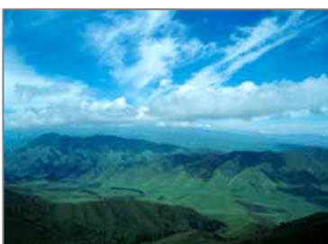
Ся'эрсили кўриқхонаси.

Ся'эрсили (Хя'а'ерхили) кўриқхонаси Синцзян-Уйғур автоном округи Ички Монголия автоном райони Бортала шаҳрининг префектурасида Олатов тизмаси шимолий қияликлари бўйлаб жойлашган (E81°43'-82°33', N45°07'- 45°23'). Шимолда Қозоғистон билан чегарадош. Бу районнинг биохилма-хиллиги яхши сақланиб қолган, чунки узоқ вақт давомида бу ерда инсон фаолиятининг таъсири билинмаган. Бу Марказий Осиё ва Монгол ўтиш регионларида камдан кам учрайдиган ҳол.