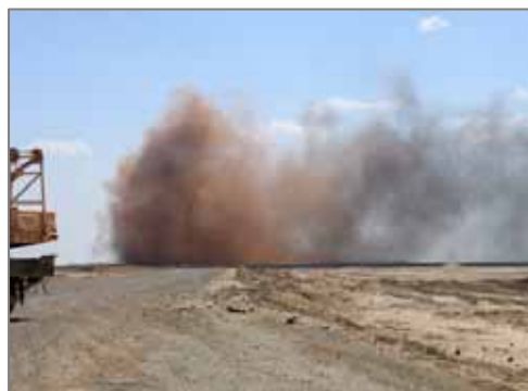
Туллей газоконпрессор станцияси яқинида газнинг авариявий чиқарилиши.

Табиий газ қазиб олиш бўйича Ўзбекистон 8чи ўринни эгаллайди. Ўзбекистон заҳираларининг 2,44 триллион кубометр газидан 1,7 триллион кубометри Устюрт платосида жойлашган. Устюрт платоси, шунингдек умуртқали хайвонларнинг 250 тури учрайдиган, ноёб табиий ресурслик ҳудуд бўлади. Сайгоқ Устюрт фаунасининг муҳим вакилларида бири ҳисобланади. Регионнинг узоклиги ва бориш қийин бўлганлиги, шу билан бирга ўзлаштирилганлигининг пас даражаси, ноёб табиий комплексларни деярли тегилмаган ҳолда сақланишига имкон берди. Бироқ, аҳолини фаровонлигини пасайишига ва ишсизликка олиб келган, Орол муаммоси билан чуқурлашган иқтисодий вазият табиатга антропоген таъсирини кучайишининг сабабларидан бири бўлди. Хусусан, сайгоқни ноқонуний овлаш даражаси бир неча бор ошди. Бироқ браконьерлик – ноёб тур учун ягона хавф-хатар эмас. Устюрт регионининг энергетика секторини ривожлантириш соҳасидаги Ўзбекистон ва Россия биргалигида лойиҳаларини амалга оширилиши сайгоқнинг аҳолини ёмонлашишига жиддий асос бўлади.