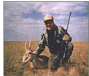
веб-сайтдан олинган сурат http://www.tigers.ru/inters/ecology/saigak.html

Батафсил http://news.ferghana.ru/detail.php?id=240977376138.44.1891.2022197 да