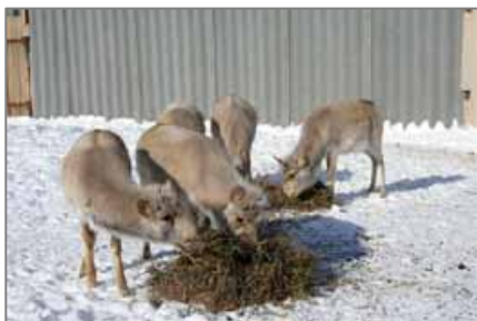
Сайгоқчаларни озиқлантириш

. Кундузи эркагини урғочиларига ирғиши кузатилмади. 27 декабр куни, бизнинг кузатишларимиз вақтида эркагида куйкиш белгилари ва урғочиларига қизиқиши кўринмади. 12 январдан 15 январгача оёғи хали тузалмаган шикастланган урғочида (унга Жади деб ном қўйилди) куйкиш белгилари кузатилди. 12 январ куни эрталабки озиқлантириш вақтида, урғочиси куйкиш қаттиқ товуш чиқарди, бунга балоғатга етган эркаги фаол жавоб қайтарди. Ундан шифер тўсиғи билан ажратилган еш эркаклари ҳам хаяжонландилар ва жавоб бердилар. Жади яримочиқ вольер эшигидан чиқиб кетишга уринарди, бундай ҳолат илгари кузатилмаган эди. Январ ойида еш эркакларида куйкиш белгилари ва куч синаш элементлари билан фаол ўйноқлик ахлоқлари кузатилди. Бошқа хайвонларга нисбатан оқсоқ эркаги ўсишда бир қанча орқада қолиб, кам ҳаракатчан эди. Уччала урғочи ҳам қочган эди. Биринчи сайгоқ боласи (эркаги) 17 май куни соат 18 да туғилиб, 1,5 соатдан кейин ўрнидан туриб, онасини чақирди. Иккинчи сайгоқча 19 май куни туғилди. 14 июнда Жадининг сайгоқчаси туғилди