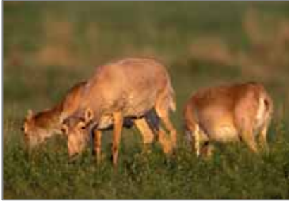
Ўтлаётган сайғоқ ургочилари.

Б. Убушаев, Қалм. Респ. бўйича Росқишлхўжназорати Бошқармаси овназорати бўлимининг бошлиқ ўринбосари