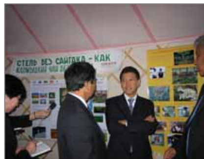
Қалмоғистон Республикаси Раҳбари Ёввойи ҳайвонлар марази директори билан сайгоқни сақлаб қолиш бўйича саволларни муҳокама қилаяпти.

Ташриф-марказ кейинчалик ҳам ривожланади ва Республика экологик таълим ва тарбия маркази сифатида ишлайди. Буюк Британия Дарвин ташаббуси дастури, SEPS, Йирик ўтхўрлар бўйича фонд, АҚШ балиқ ва еввойи қушлар хизмати, Денвер ҳайвонот боғи, Ҳайвонот боғи ёрдам фонди, Колорадо ҳайвонот боғи, ИТЕРА, TNT-Express каби кўпгина халқаро ташкилотлар ташриф – марказ қурилишида молиявий ёрдам кўрсатдилар.