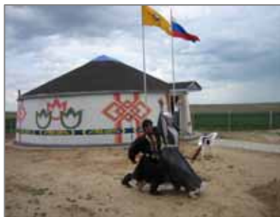
Ташриф-марказ ёнида раққослар репетицияси.

Ташриф-марказ сайгоқ экологияси ва уни кўриқланиши ҳақида сўзлаб берадиган стендлар, Қалмоғистон маданиятига бағишланган материал ва компьютер кўрсатиш воситалари билан жиҳозланган. Шу билан бирга питомникда илмий иш олиб бориш учун жиҳозлар ва ўқувчилар ташрифига синф хонаси ҳам мавжуд. Бу ерда кўпгина маҳаллий ва халқаро билим юртлари билан қалин алоқалар юзага келиб, у ердаги талабалар сайгоқни ахлоқини кузатиш ва уни кўпайтириш усулларини ўрганиш учун питомникка келадилар.