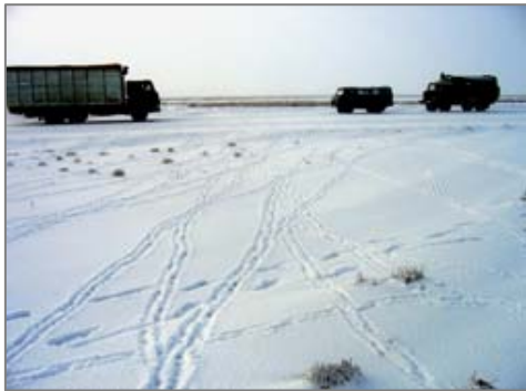
Жаспық станциясы маңында жолды кесіп өткен ақбөкен іздері.

Ақбөкенді қыру мен оның етін тасымалдау бірнеше күнге созылса да, жергілікті елді мекеннің әкімшілігі, табиғат қорғау органдары ешқандай шара қолданбады. Ол жылы ақбөкендердің оңтүстікке қарай көп шұбыруы оның санының өскендігінен емес, Қазақстанда қалың қар түсуінен және азық тауып жеуі қиынға соққан соң болды. Әрі қарай шығынға ұшырамыс үшін ақбөкендер өздерінің қоныс аудару бағытын өзгертуге тура келді. Енді олар Үстірттегі Қомсомолск поселкасы маңынан Аджибай арқылы Арал теңізінің құрғап қалған жері арқылы шығысқа қарай кететін болды. Қарақалпақстанның Тақтакөпір ауданына дейін барады. Қызылорда облысының территориясына еніп, сексеуілді шөлді қыстайды. Бұл қоныстары ауа райы, азықтары жөнінде Түркіменстан жеріне қарағанда онша қолайлы емес. Аңның қоныс аударудың жаңа бағытында ашық үлкен территорияны да (200 км) кесіп өтеді; онда бірқатар газ шығаратын аудандарды басып өтеді.