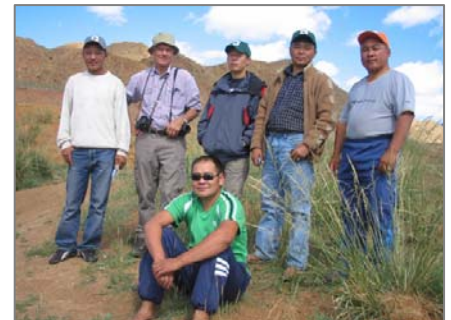
Д-р Х. Юнгиус командасымен ұлы көл жазығында (Моңғолия).

Проектіні жүзеге асырудың алғашқы қадамы жергілікті бақташылармен келісім жүргізуден басталады. Бұл процесті Қоршаған орта Министрлігі, жергілікті үкіметтің өкілдері және WWF басқарады. Бақташылармен Орталықты салатын жерді анықтап, оның маңындағы 20000 га суы бар жер мал жайылмайтын участок болу керектігі туралы келісімге келу керек. Оның орнын толтыру мәселесін де шешу қажет. Ол үшін Хомин Тале және Хустейн Нурудағы проектілердің тәжірибесін пайдаланады. Өсіру, Көбейту программасын орындауда Қалмақия тәжірибесі пайдаланады. Онда моңғол мамандары – тәжірибеден өтеді және қалмақ экспертін программаның орындалуына көмектеседі.