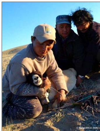
WCS-тің дала командасының мүшелері табиғи резерват Шаргада ересек аналық ақбөкенге радио-ошейникті бекітіп жатыр.

Мұндай программаның ең кемінде 6-8 жыл жұмыс істеу жағында қолдау қажет. Жыныстық жағынан аналықтар 7-8 айда, текелері 1.5 жылда жетіледі. Вольердік популяцияны құру және табиғи ортаға жіберетіндей санын көбейтуге 3 жылдай уақыт кетеді. Проектінің мақсатын толық орындау үшін жыл сайын табиғатқа жіберуде ойластырылады. Қазірде қаржы табу мәселелері қарастырылып жатыр.