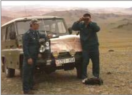
Браконьерлерге қарсы Ирбис-3 мобильдік тобы.

2006 ж. 21-ші қыркүйегінен 13 қазанға дейін Элиста қаласында болгарлық В.Топалов пен Ресейлік В.Крамник арасындағы шахматтан дүниежүзілік біріншіліктің арнаулы талисманы ақбөкен құралайы болды – Қалмакия символы. Эмблема жобасының авторы белгілі қалмақ суретшісі Сергей Бадендаев. Толығырақ: http://www.elista.org/elista/index.php?option=com_content&task=view&id=758&Itemid=2 .