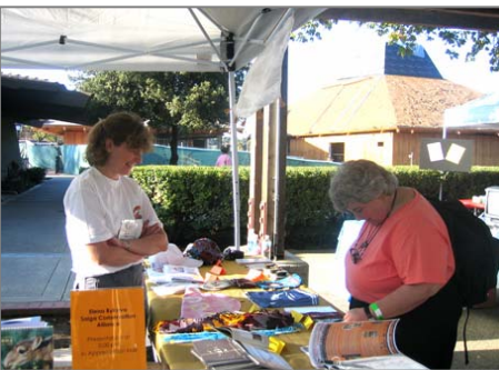
«Экспо-2006» қатысушылар (жоғарғы); ақбөкенді сақтау Одағының экспозициясы (төменгі).

Биыл ақбөкенді сақтау Одағы жыл сайын өтетін табиғатты қорғаудың Хомықаралық «Экспо-2006» көрмесіне қатысуға шақыру алды. Бұл көрме 6-8 қазанда (2006 ж.) АҚШ-та Лос-Алто (Калифорния штаты) қаласында ұйымдастырылды. «Экспо-2006» көрмесін жабайы табиғатты сақтау сеті (WCN) өткізді.