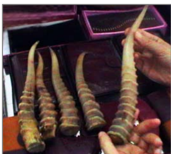
Қытайдың традициялық медицинасында ақбөкен мүйізі қолданылады.

Қазірде FFI қоныс аударатын түрлер Конвенциясына қол қойып, Қазақстан мен Өзбекстан территорияларындағы ақбөкеннің Үстірт популяциясын сақтап қалу жұмыстарын кеңейтуді жоспарлауда. Фауна мен флораның халықаралық фондысы партнерлық проектілер үшін ашық, ақбөкенді қорғауға тартылған жергілікті ұйымдарға көмек беруге дайын әрі ақбөкен мекендейтін төрт елдің шөл далаларды жақсартуға бағытталған шараларын қолдайды. Қосымша мәліметтерді Ричард Оллокориен аласыздар, FFI, ralcom@fauna-flora.org