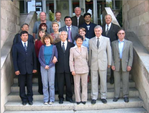
Ақбөкен жөніндегі мамандар Алматыда кездесті.

«Саны азайып бара жатқан ақбөкеннің өніп-өсу экологиясы» атты Интас проектісіне (жобасына) қатысушылардың қортынды кездесуі 2006 ж. 21-22 қыркүйегінде Алматыда (Қазақстан) өтті. Кездесу барысында зерттеулердің нәтижесінде алынған ғылыми мәліметтер, оларды талдау және бұл мәліметтерді 2007 ж. наурыз айына дейін баспа бетінде жариялау сөз болды. Бұл жоба Қазақстанда, Өзбекстанда және Ресейде жүргізілді. Негізгі мақсат – ақбөкенге мониторингтік бақылау жүргізіп, оның таралуын, топ құрауын және өніп-өсу процесін қазіргі жаңа әдістемелер арқылы зерттеу. Сондай-ақ бұл проект жақында біткен «Ауыл тұрғындарының жағдайын жақсарту үшін ақбөкенді пайдалану» атты «Дарвин Инициативасы» жобасымен байланысып жатыр. Соңғы жобада ауыл тұрғындары арасында социальдық зерттеулер жүргізіліп, олардың бұл аңға деген пікірлерін анықтаған еді. Біз, негізінен, ақбөкенді сақтау және оның экологиясы жөніндегі мәліметтерді ғалымдар, жергілікті тұрғындар және саясаткерлер арасында таратамыз.