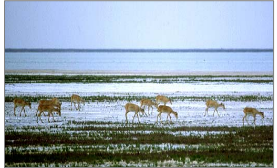
Ақбөкеннің қоныс аударуы. Сурет Л.Лахманнанікі

Бұрын Үстірт қыратына бір ғана ақбөкен группировкасы – Үстірт популяциясы келеді деп саналатын; олардың қоныс аудару бағыты да жылдан-жылға өзгеріп отырады: кейде ол Бозаши түбегіне, кейде Оңтүстік Үстіртке немесе Сам құмына қарай ауатын. Оның себептері - адамдар оларды үнемі қадағалап отыратын немесе ауа райының кенеттен өзгеруі болатын. Кей бірпікірлер 1954 ж., ақбөкен санының қалыптасуына байланысты олар Үстірт қыратына өніп, онда жаңа группировка құрды деп санайды. Олар Оңтүстік Үстіртті, Жанакені, Қарақұмды қыстайтын болды. Ал, жазға қарай олардың басым көпшілігі солтүстікке қарай бет алып, ал аз бөлігі сол жерде қалатын. Солтүстік-Батыс Түркістанда олардың саны 40-50 мыңдай болатын, ал жазда бірнеше жүзден 30 мыңға дейін. Бұл жұмыстың мақсаты – Арал-Каспий аралығындағы территорияда (Қазақстан, Өзбекстан (Қарақалпақстан), Түркімения) ақбөкеннің тіршілік ету жағдайын баяндау.