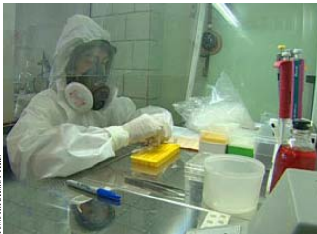
Фото ИИ Ветеринария

При вскрытии трупов отмечены гиперемия и уплотнение легких, кровянистое содержание грудной полости, гиперемия и некоторое увеличение печени и селезенки. У больных животных наблюдались сильное угнетение,