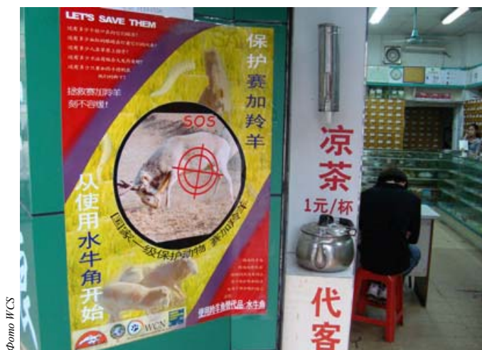
Команда «Сайгак навсегда» разместила свой плакат в аптеке ТКМ.

Еще одна команда, названная «Сохранить сайгака», планирует организовать конкурс рисунка в городе Хуйжинг, р-н Тианхэ, Гуаньжоу, с целью привлечь как можно больше людей к сохранению сайгака.