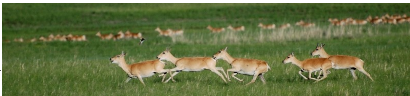
Стадо бегущих дзеренов.