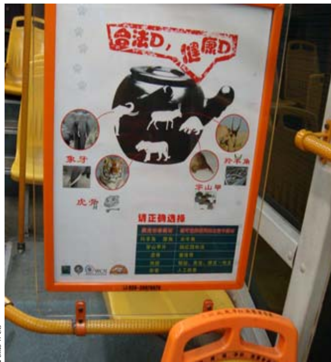
Плакат по сохранению сайгака в гуаньжоуском автобусе.

Одна команда, названная «Сайгак навсегда», сосредоточилась на потребителях лекарственных препаратов. С февраля по март 2010 г., используя созданные ими самими плакаты и брошюры, школьники провели мероприятия на улице Феникса, р-н Хайцзю. Они убедили работников аптеки ТКМ этого района, повесить в аптеке свой плакат. Покупатели, которые собирались приобрести лекарства в этой аптеке, получили брошюры по сохранению сайгака. Команда также организовала