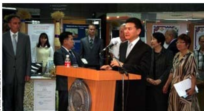
Приветственное слово Кирсана Илюмжинова.